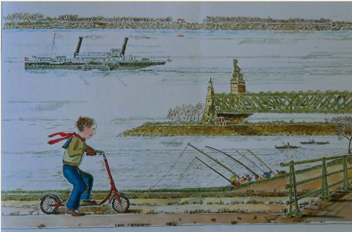
Farbstiftzeichnung „Otto Wagner-Bauten“

Meine zweite größere Reise begann Ende der 50er Jahre im Herbst. Mit meinem Fahrzeug fuhr ich vom Kammerjoch entlang des Kuchelauer Hafens.