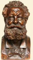
Karl Lueger – Büste von Zelezny

Der Eingang der Schule ist heute noch sichtbar, gleich links hinter dem Bildstock. Meine ehemalige Volksschule, erbaut 1899 unter Bürgermeister Lueger, ist ein späthistoristischer Bau mit Neorenaissance-Elementen (Wigandgasse 29).